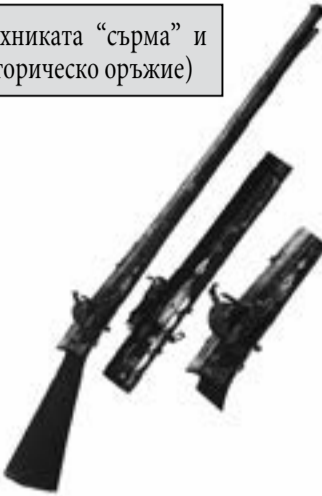
оръжие в тази категория, което е било видоизменено в изстрелващо халосни боеприпаси, боеприпаси с дразнещи вещества, други активни вещества или пиротехнически изделия или сълютно или акустично оръжие”.

Увеличава се приложното поле на оръжията на разрешителен режим – от категория „В”. Тук, в изброените девет вида оръжия, попада и „ всяко огнестрелно