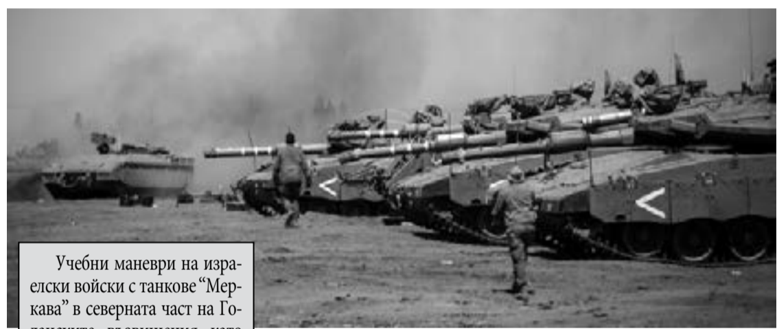
Учебни маневри на израелски войски с танкове „Меркава“ в северната част на Голанските възвишения като симулация на действия при евентуален конфликт с „Хизбула“ (13 септември 2017 г.)

подкрепиха Израел) и преуспяха. Руските войници едно след друго показват, включително и наскоро в Сирия, че притежават същата голяма храброст. Обаче руските политици изглеждат са по-равнодушни и корумпирани, и винаги има риск Путин постепенно да става повече политик и по-малко войник. На свой ред, това значи, че ние, които сме срещу Империята и подкрепяме Путин и Русия, задължително трябва ясно да подчертаем, че подкрепата трябва да е мотивирана от редица морални и духовни принципи, а не просто върност на принципа „това е моята страна, все едно дали е права, или не“, или нещо по-лошо – „врагът на моя враг е мой приятел“ .